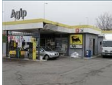
MILANO Via Fantoli 18